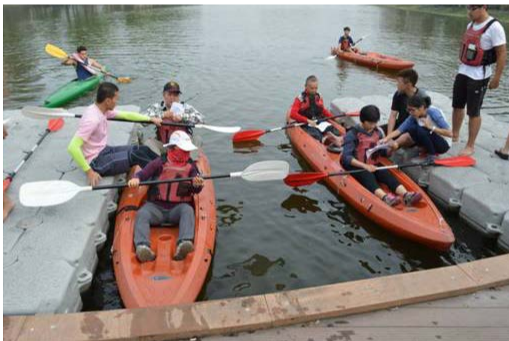
看見到來的老爺爺老奶奶們很認真地完成任務，也玩得開心的笑容，讓我們也不自覺地被感染到這股認真地的氣勢及笑容。