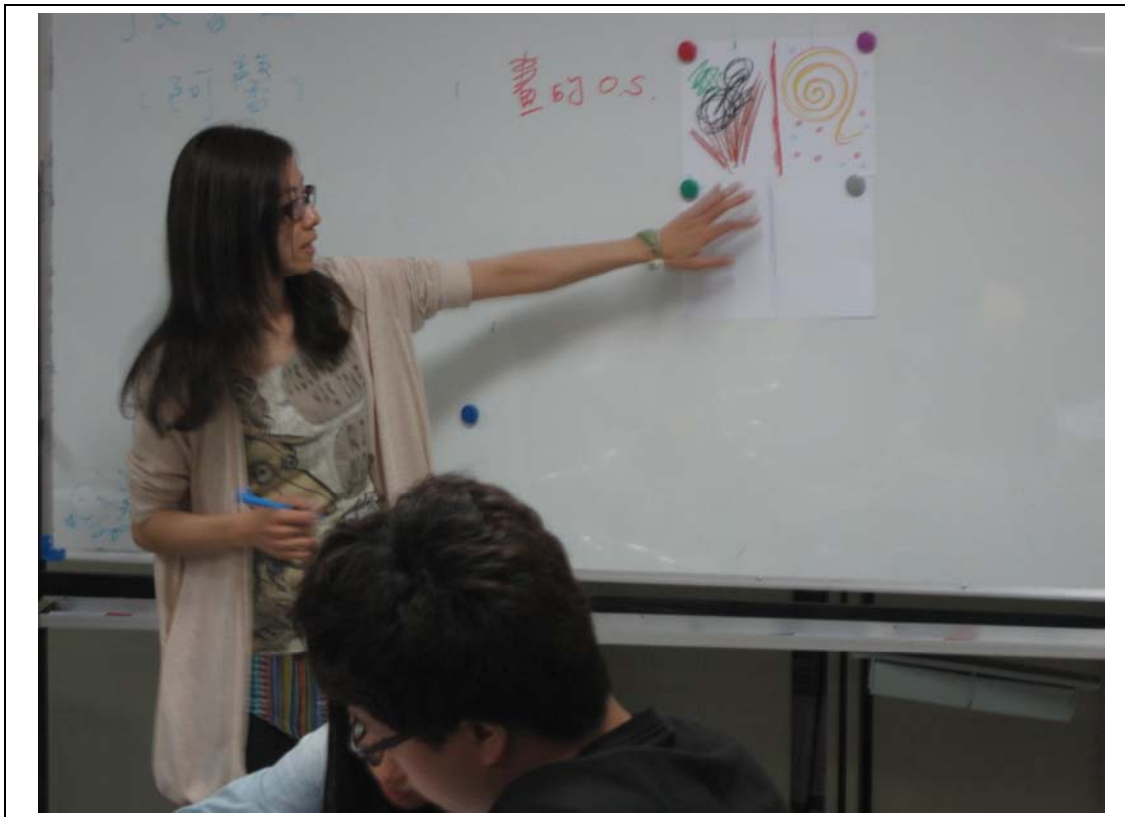
相片及內容說明：講師邀請同學為畫填上 O.S.，圖形及文字展現不同層次的對話。

活動名稱：覺察與對抗!內在小孩的自我對話 編號：18-1 活動日期：103年04月23日(週三) 活動地點：資源教室 主辦單位：學務處諮商輔導中心 參加對象：全校學生