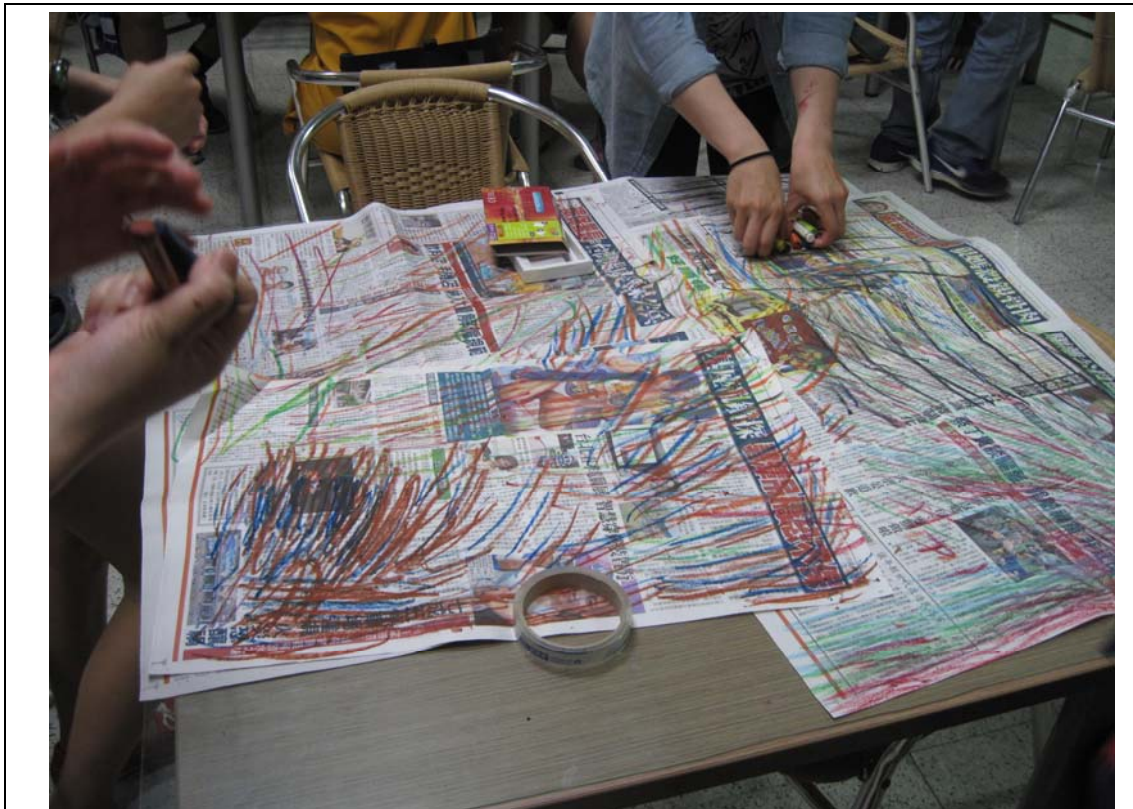
相片及內容說明：試過用左、右手塗鴉嗎?不考慮圖形、美醜，把想法徹底解放!