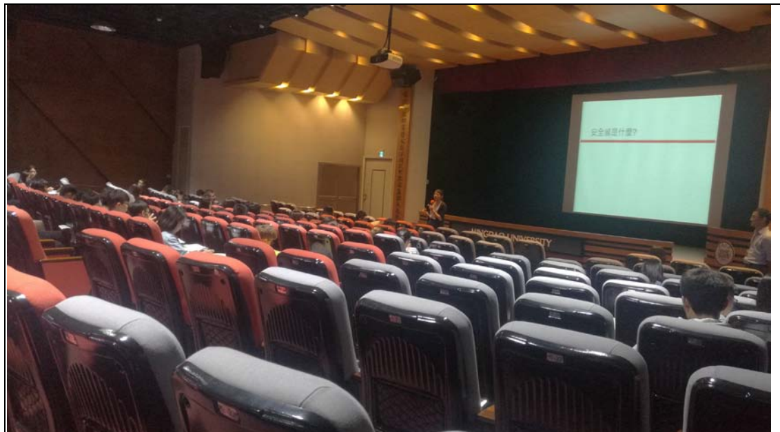
相片及內容說明：邀請現場的同學們思考，什麼是安全感？