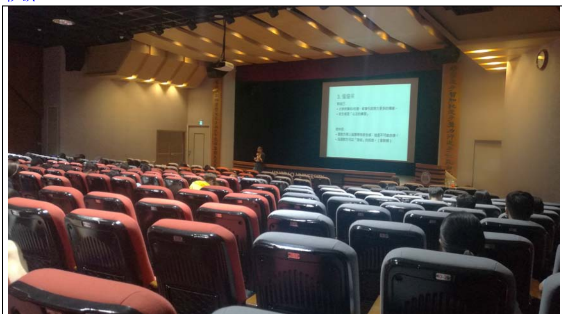
相片及內容說明：分了數點說明在愛情中要是發生爭執可以怎麼做