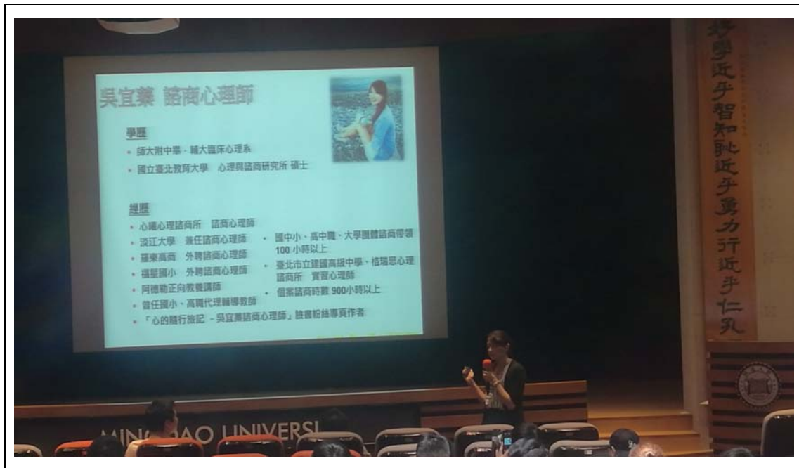
相片及內容說明：宜蓁心理師介紹自己的專業背景