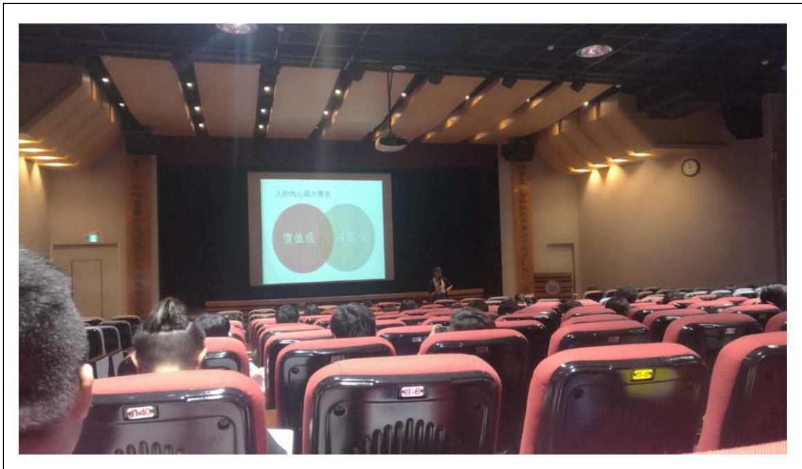
相片及內容說明：在歸屬感跟價值觀之間是有重疊之處的