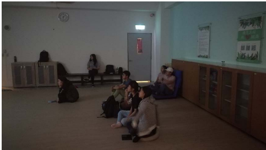
相片及內容說明：同學可以根據自己的喜好搬旁邊的和式椅使用