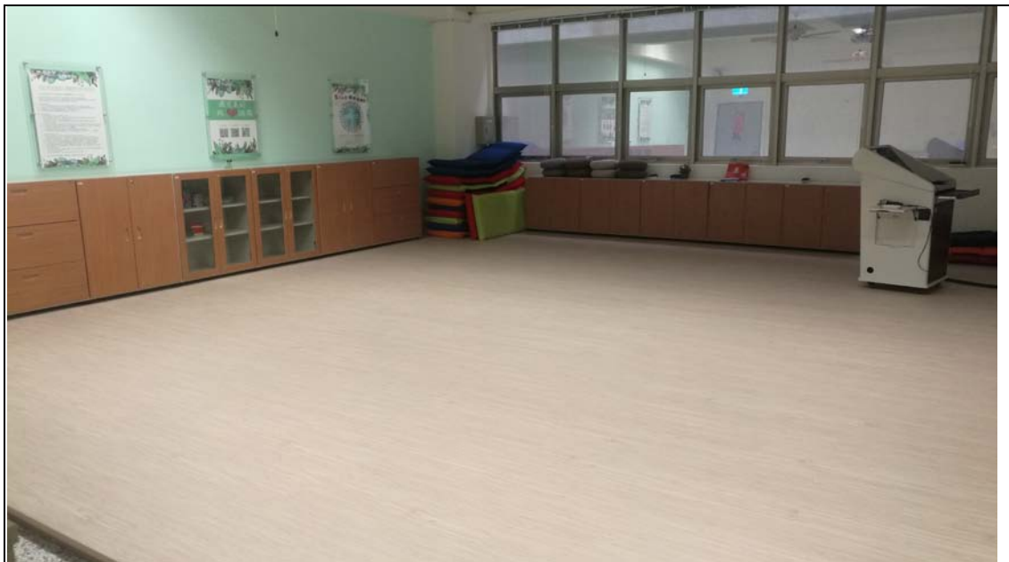
相片及內容說明：使用團體諮商室，寬敞有質感的空間