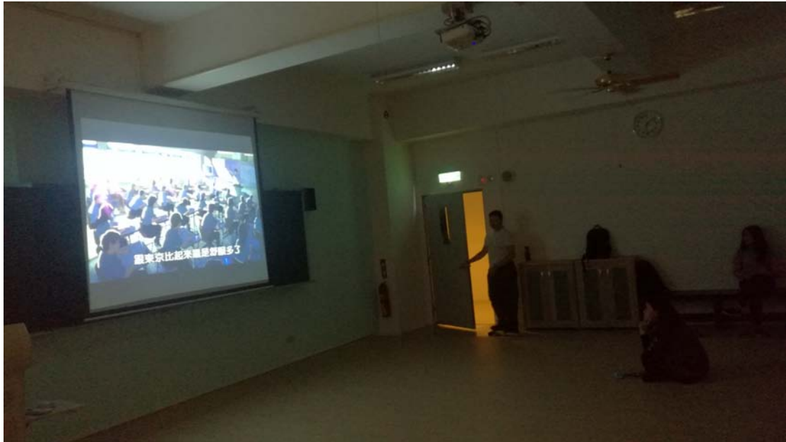
相片及內容說明：電影開始了大家陸續入坐