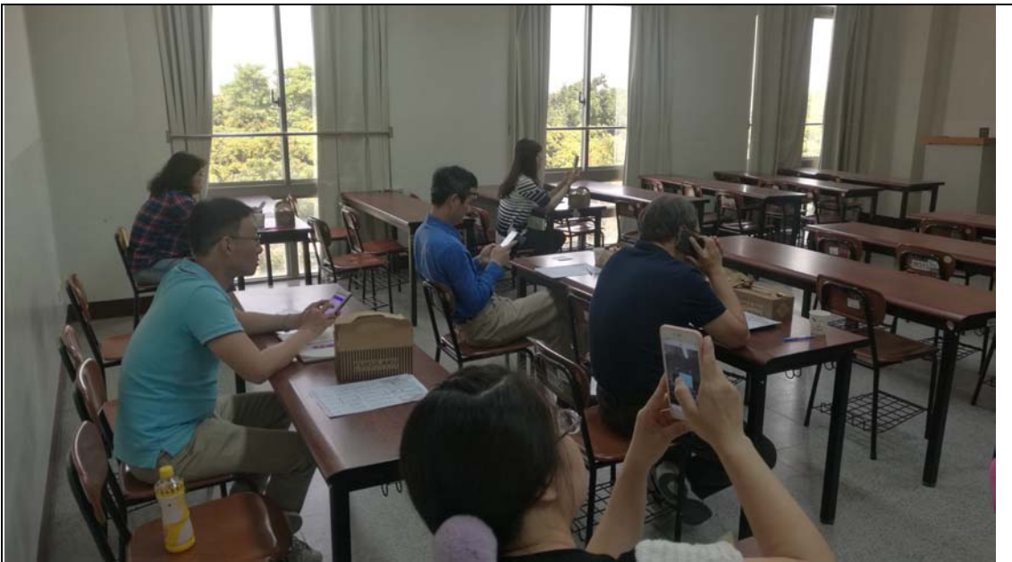
相片及內容說明：透過線上問卷的方式來邀請各位老師分享自己的想法