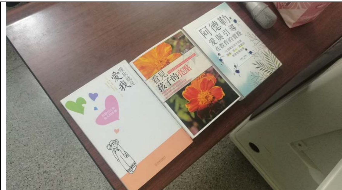
相片及內容說明：胤國心理師分享可以閱讀的相關書籍