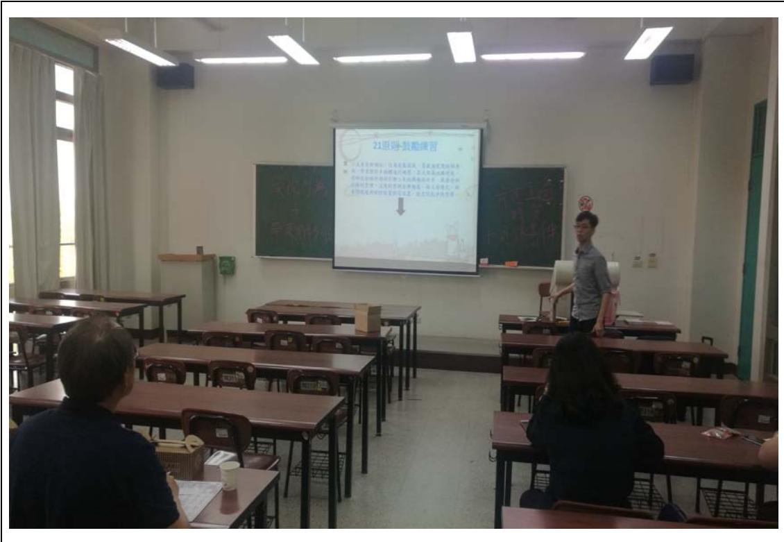
相片及內容說明：胤國心理師整理每個鼓勵技巧的原則及重點