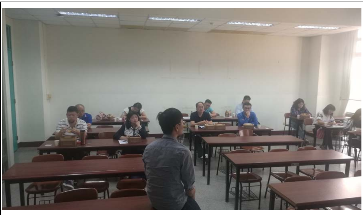
相片及內容說明：發下小字卡邀請各位老師練習怎麼鼓勵