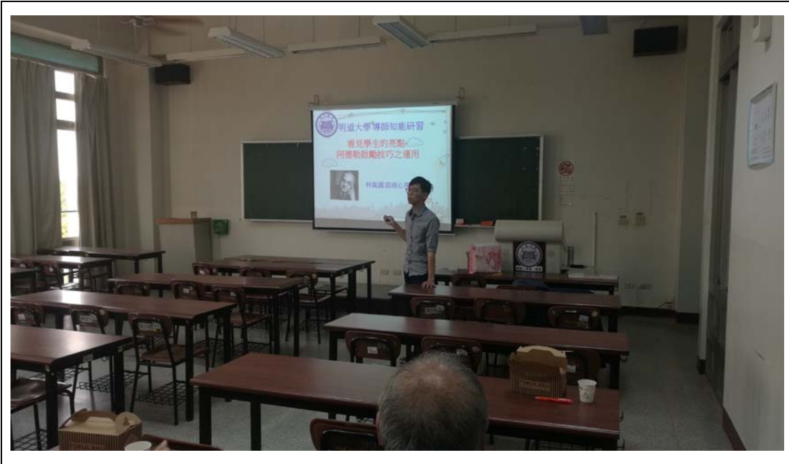
相片及內容說明：胤國心理師分享自己的專業培養背景及今天的主題