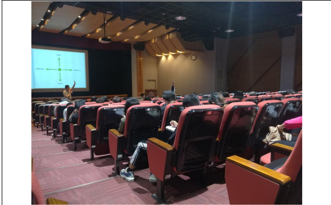
相片及內容說明： 在分享的過程親切的邀請大家互動