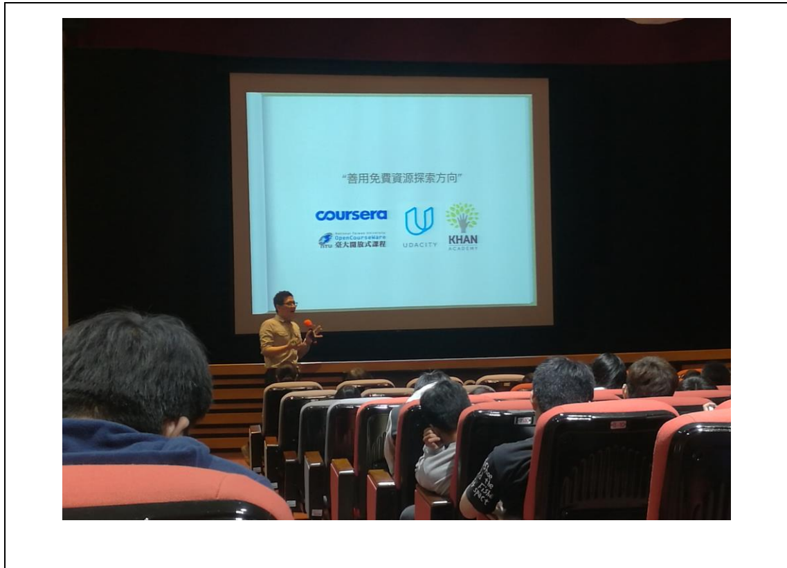
相片及內容說明： 添智老師提到有很多免費的資源可以協助大家培養第二專長

活動名稱： 成為一個夢想騎士 編 號： (18-2 ) 活動日期： 106年11月14日(週二) 活動地點： 良知堂 主辦單位： 諮商輔導中心 參加對象： 全校學生