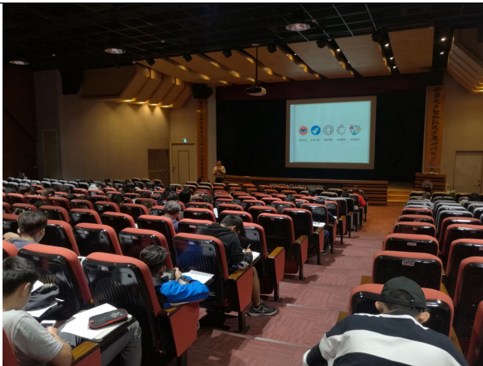
相片及內容說明：添智老師提到，如果要找到可以付諸熱情的事情，要經過哪些重要的步驟