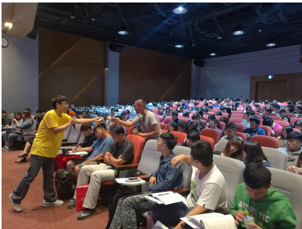
相片及內容說明：宋老師的鼓勵之下同學躍躍欲試