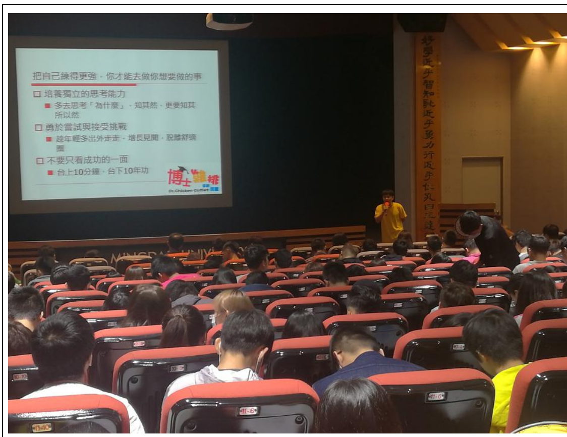
相片及內容說明：宋老師鼓勵莘莘學子多嘗試、多思考，不要害怕面對挑戰

活動名稱：雞排博士的人生大轉彎 編號：(18-2) 活動日期：106年11月01日(週三) 活動地點：良知堂 主辦單位：諮商輔導中心 參加對象：全校學生