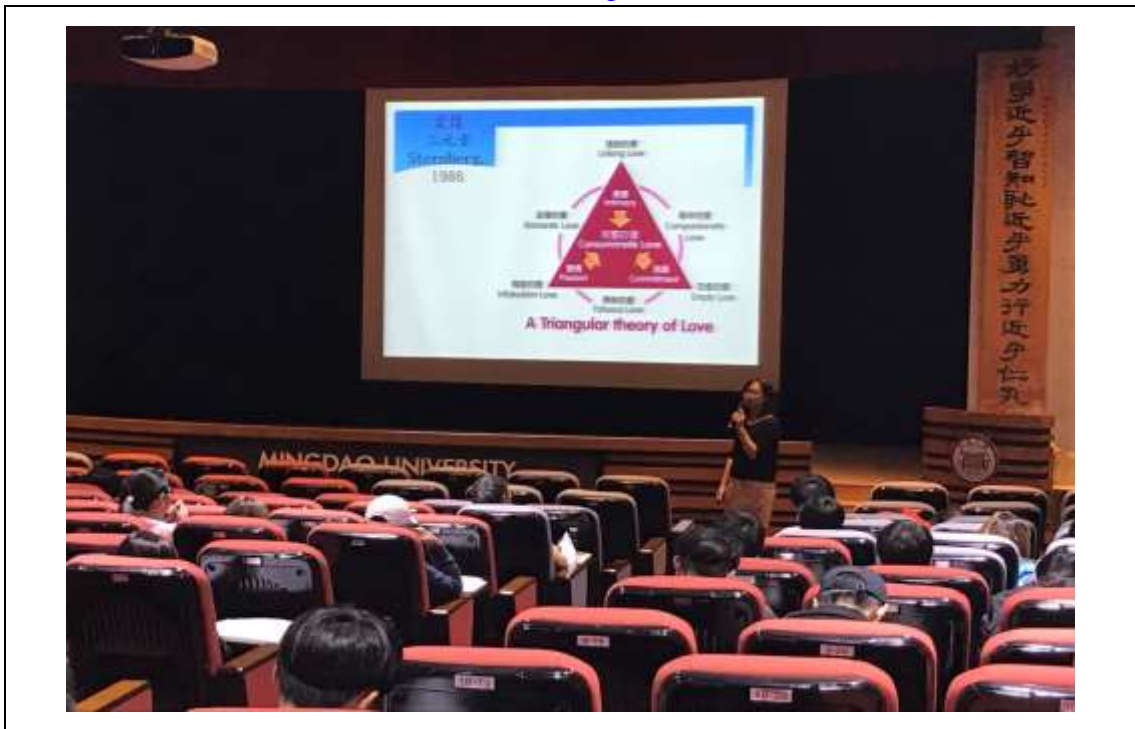
相片及內容說明：過去以為人長大了自然就會談戀愛，不需像上課這樣的學習，然而現在社會對感情的訴求與過去著重於婚姻承諾、傳宗接代不同，還渴望親密與激情。