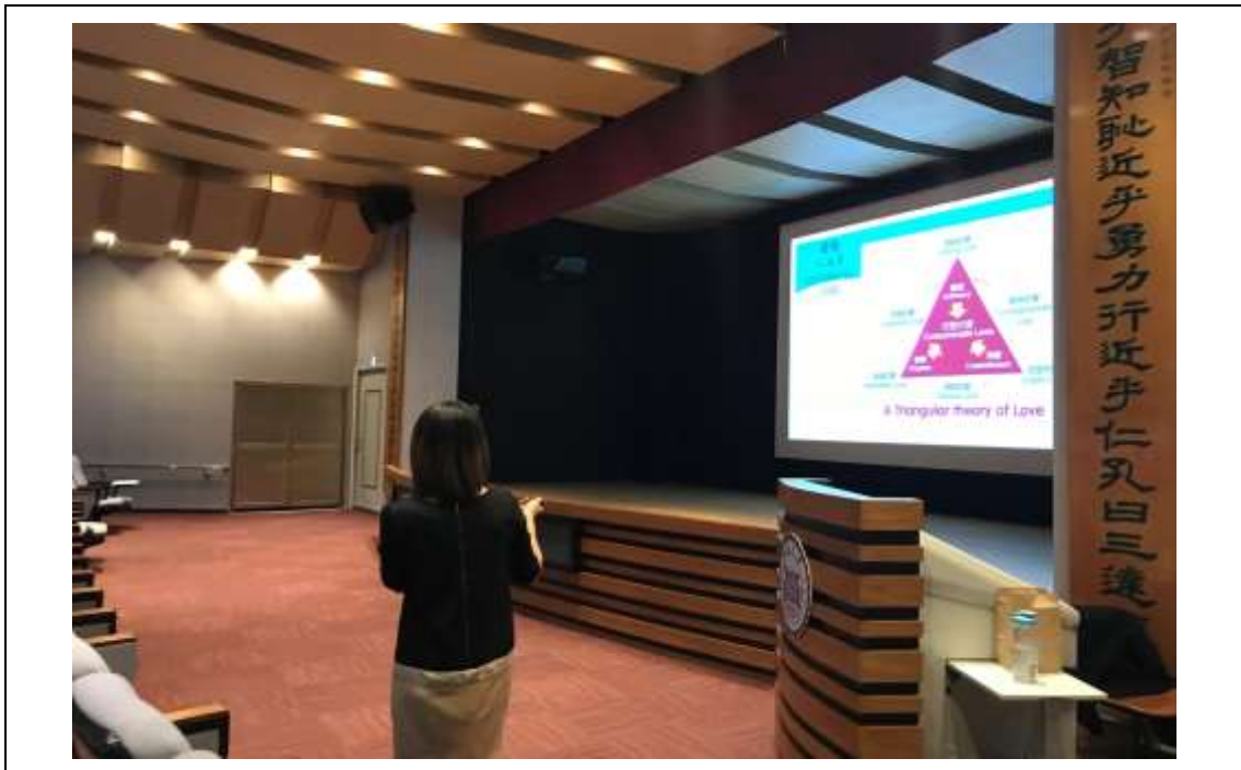
相片及內容說明：最著名的愛情三元論講的重要元素：激情、承諾與親密，組成完整的愛；而不同元素組合出不同的愛情面貌，例，承諾與親密組合為友伴的愛。