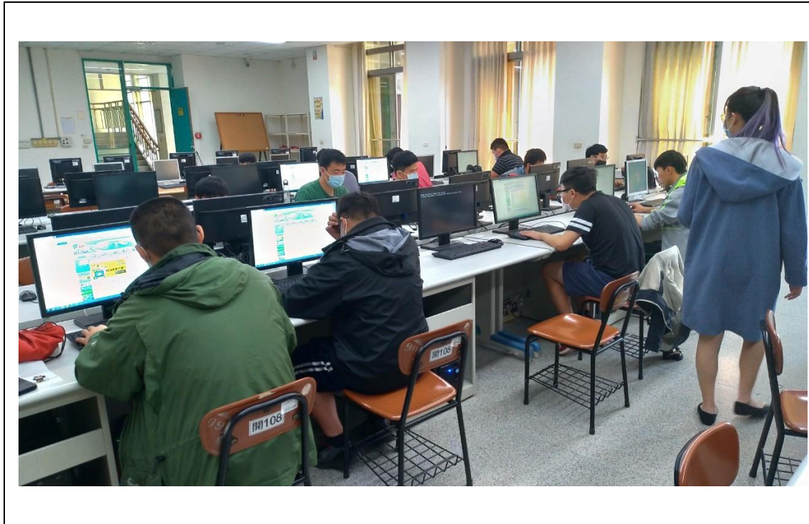
相片及內容說明：同學認真施測，也會舉手發問，講師會巡視大家做得如何。