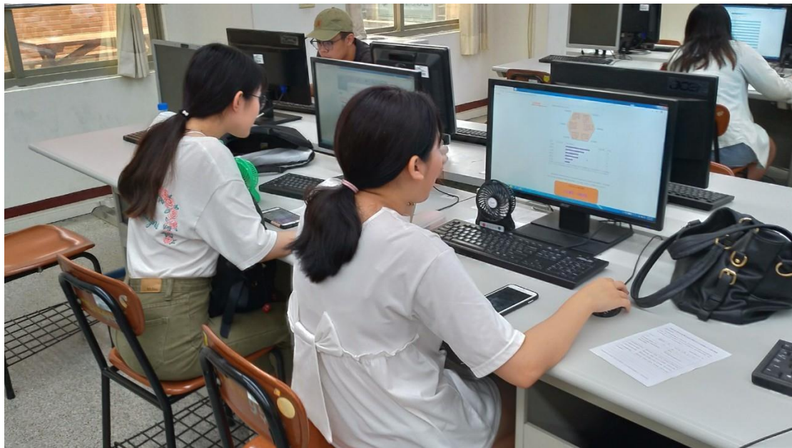
相片及內容說明：施測完的同學正好奇的查看自己的何倫碼為何。