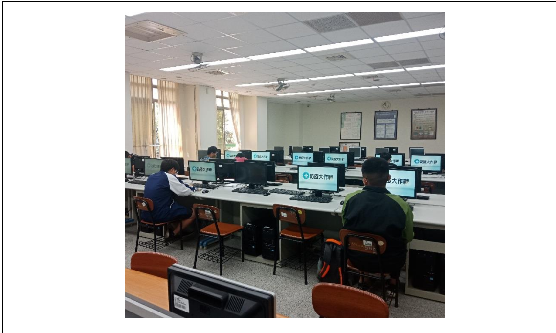
相片及內容說明：因應學校防疫措施，在活動開始前先請同學觀看衛福部提供的防疫影片。