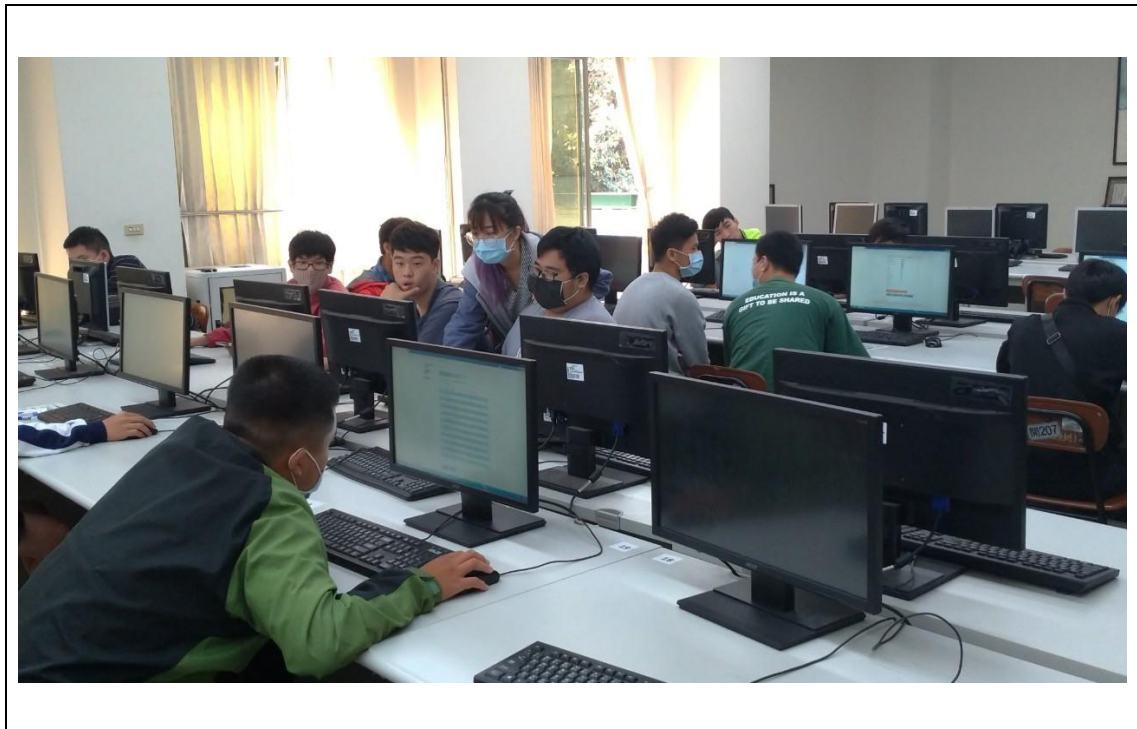
相片及內容說明：在等待還沒完成的同學時，老師先幫已做完的同學說明解釋測驗結果。