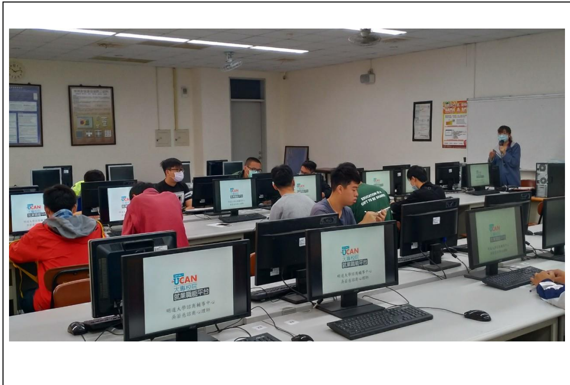
相片及內容說明：講師講解用 Ucan 測驗可以協助同學進行生涯職業探索。