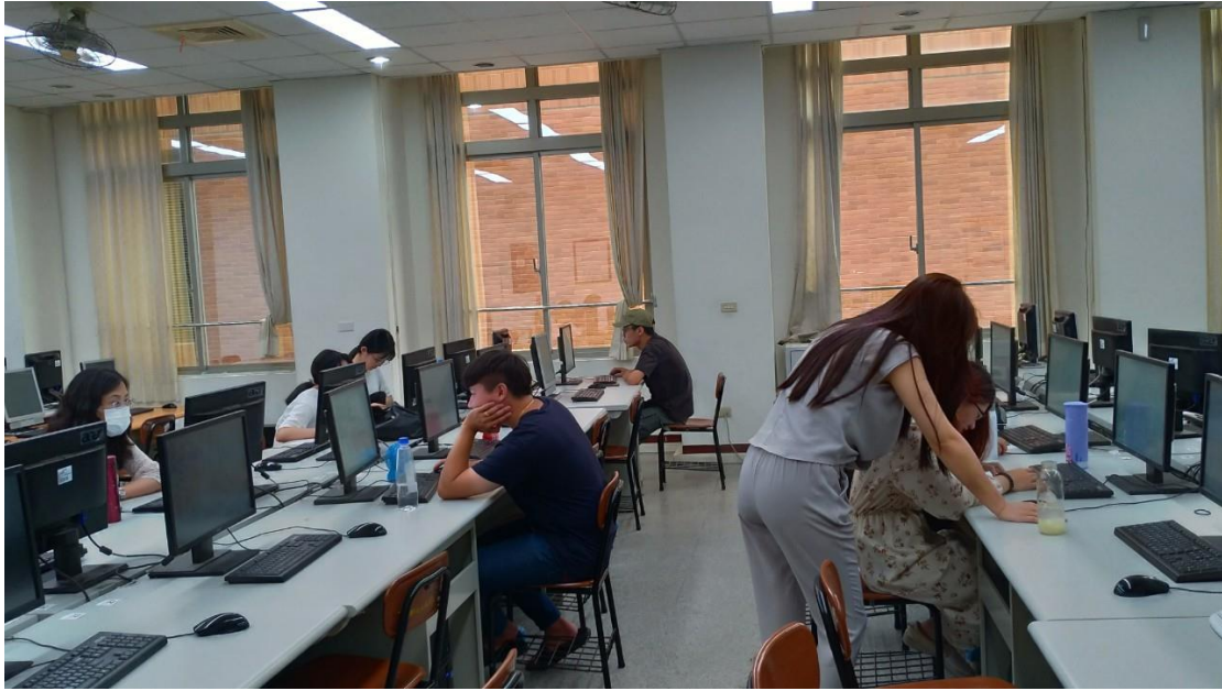
相片及內容說明：講師會一一到學生旁邊互動、說明。